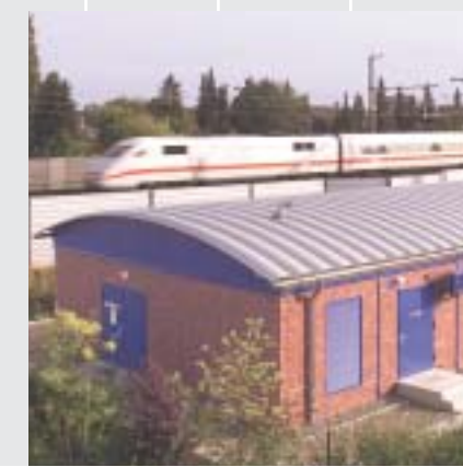
Modulgebäude, Glasfaser- und PVC-U-Kanäle wurden von LEONHARD WEISS mitentwickelt und zur Ausführungsreife gebracht. Die Bilder zeigen das Versetzen von aufgeständerten U-Kanälen und ein Fertigteilgebäude in Modulbauweise für Elektronische Stellwerke.