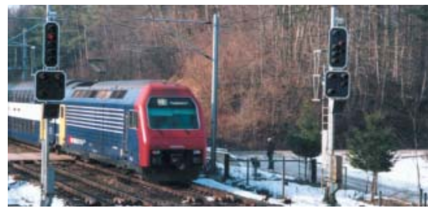
Umfassende Leistungen in den Bereichen Sicherungstechnik und baubegleitender Tiefbau unter rollendem Rad schaffen gute Verbindungen.